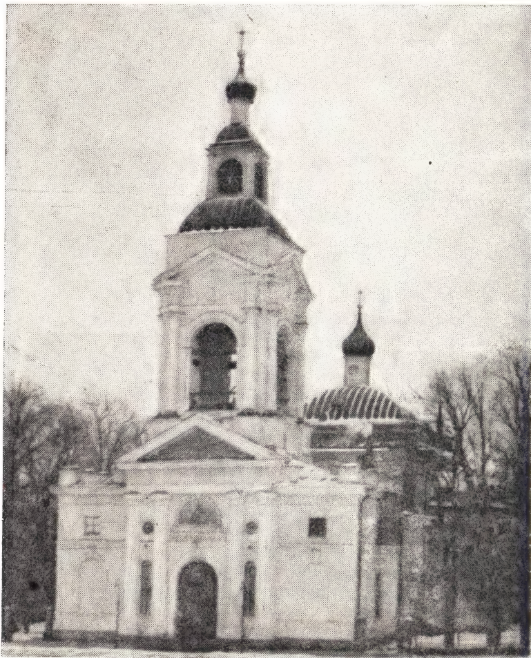
Спасо-Преображенский собор в г. Выборге

Выборгский Спасо-Преображенский собор построен старанием и иждивением русских людей в 1784—1786 г.г., о чем говорит надпись на старинной люстре собора. Позднее, в половине XIX века, собор значительно расширили и надстроили, благодаря чему изменились его архитектурные формы. Вначале собор был построен в виде кругло-очерченного креста с отдельной колокольной, сохранившей внутри и донныне